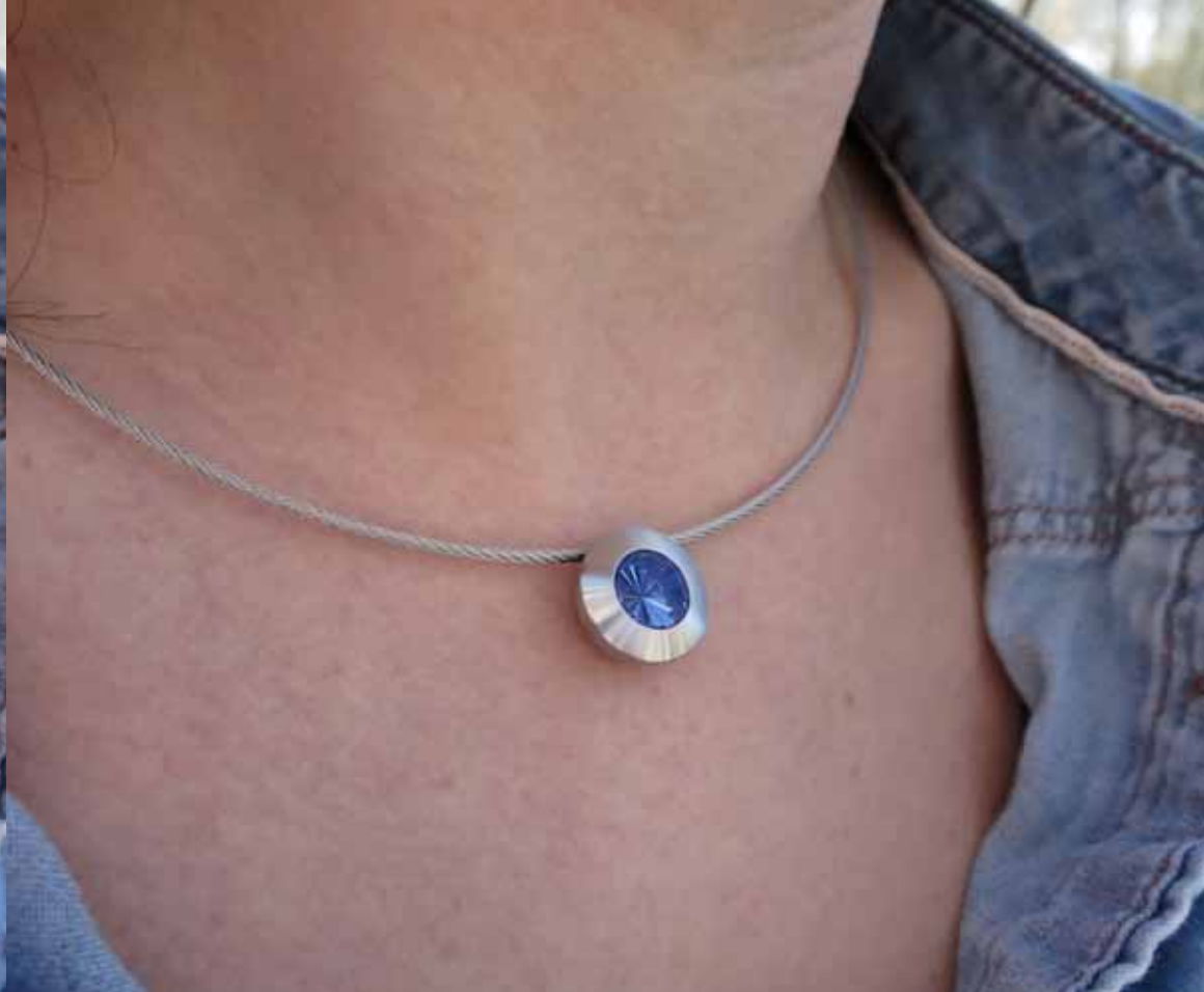
„Colour“ mit Aquamarin (Artikelnr. 10037)