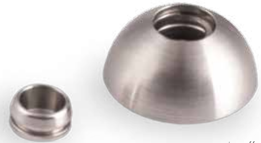
im offenen Zustand

Material: Edelstahl (Korpus) synthetischer Farbstein oder 14kt. Gelb- / Rotgold