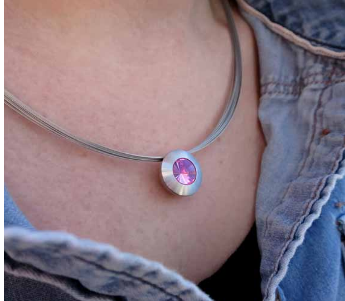
„Colour“ Rubin Rosa (Artikelnr. 10011)

Nano Secret ist dezent, zeitlos und sicher!