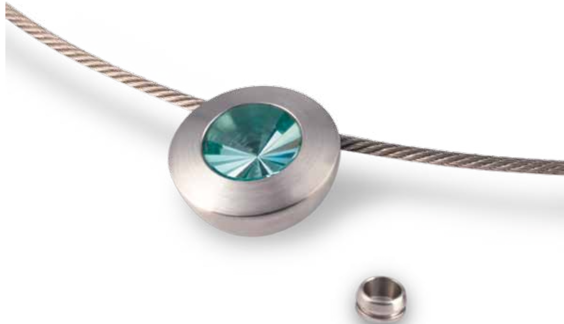
Anhänger „Colour“ in Erinith (Artikel 10017) mit offener Kapsel

Nano Solutions GmbH Elisabethstraße 23 41334 Nettetal - D www.nanosecret.de - info@nanogermany.de