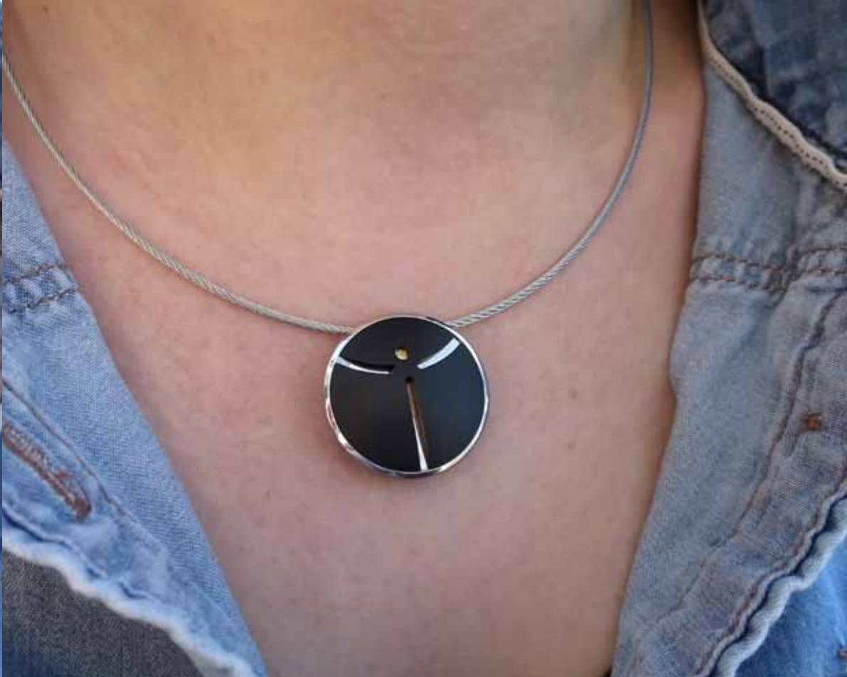
„Mono“ mit Segen, Juma®, Gelbgold (Artikelnr. 8400-S-200)