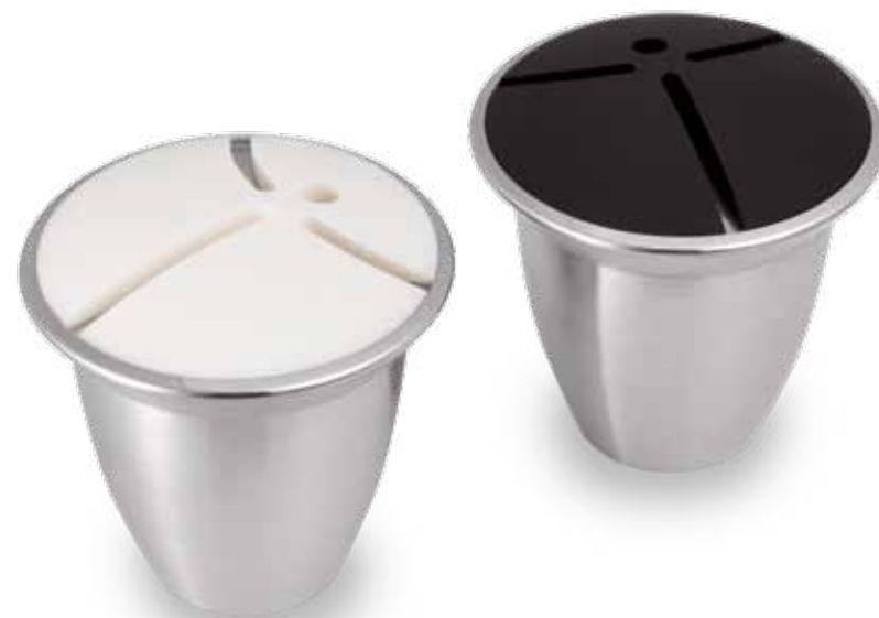
Objekte „Mono“ mit Segenmotiv