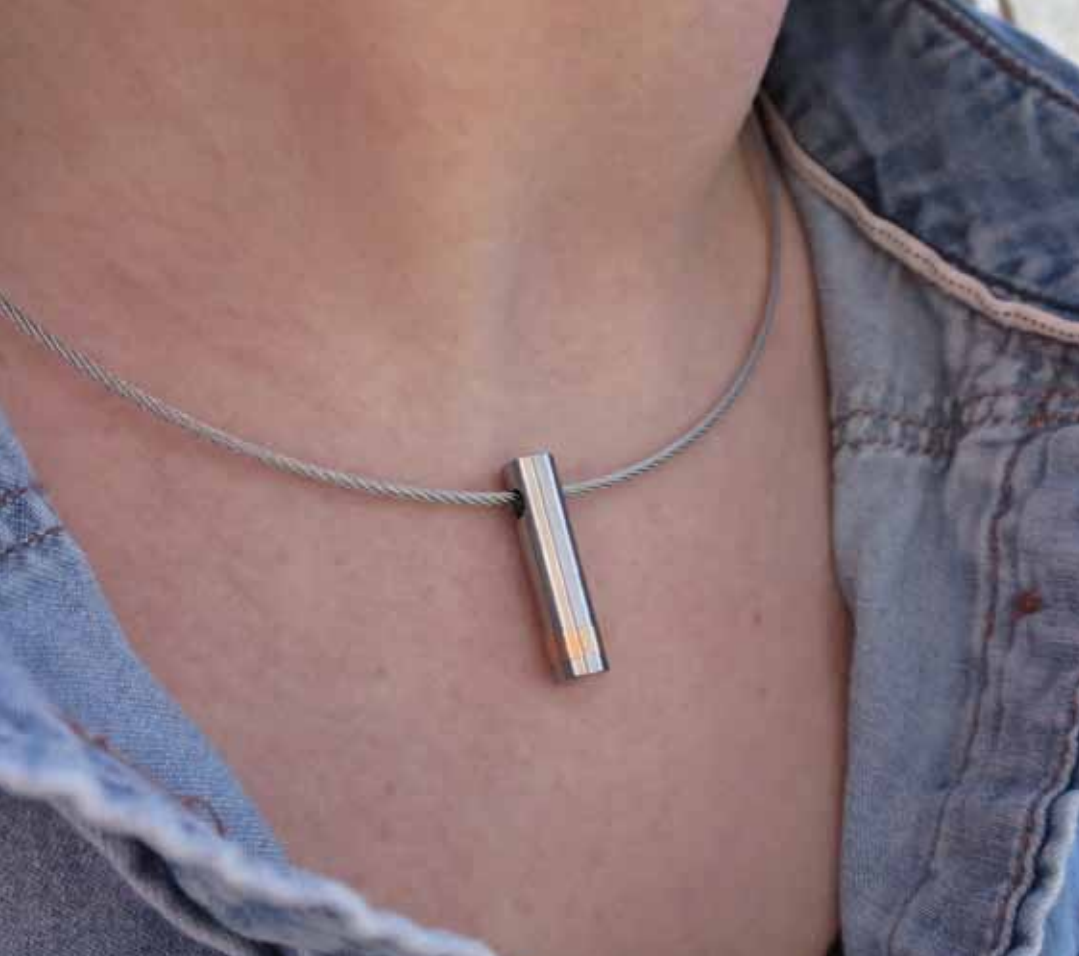
„Comma“ mit Rotgold (Artikelnr. 20201)