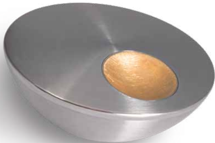
im geschlossenen Zustand

Runder Handschmeichler mit konkav gewölbter Memory-Kammer.