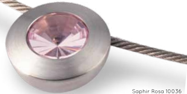
Saphir Rosa 10036