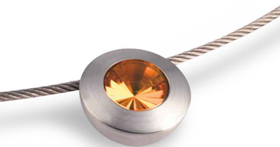
Anhänger „Colour“ in Goldsaphir (Artikel 10007)