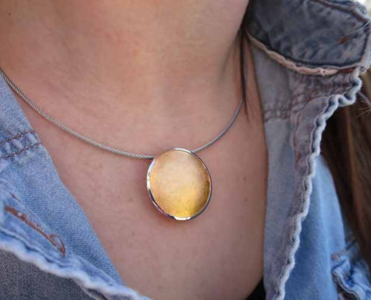
„Mono“ mit 585er Gelbgold (Artikelnr. 8200)