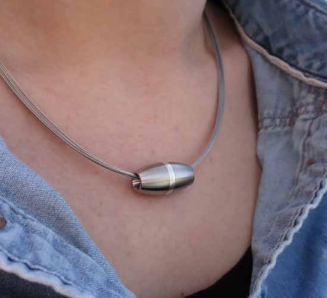
„Cocoon“ mit Silber (Artikelnr. 30300)