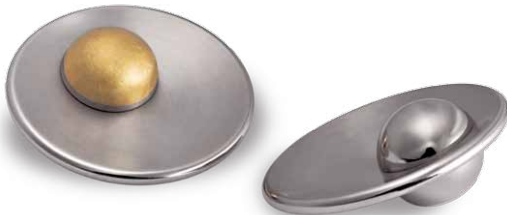
im geschlossenen Zustand

Ein flacher Handschmeichler mit einer Edelstahlscheibe, durchfasst von einer kugelförmigen Memory-Kammer.